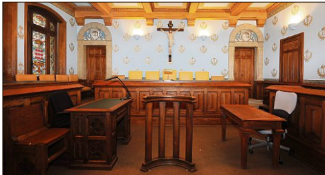
Le prévenu était absent à la barre. (Illustration MM)

Vers 13 h 15, cette dame traversait prudemment la chaussée sur le passage protégé situé à l'intersection de l'avenue du Berceau et de la rue des Violettes. Au même moment, le conducteur d'un véhicule la renversait. Souffrant d'une large fracture du fémur droit, elle était transportée au CHPG pour être opérée en urgence. Quarante-vingt-dix jours d'ITT lui